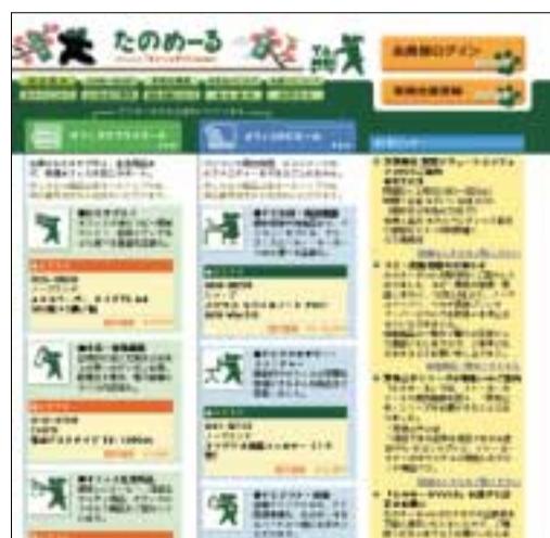
インターネットたのめーる http://www.tanomail.com