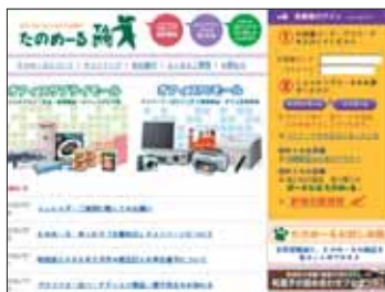
インターネットたのめーる http://www.tanomail.com