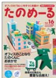
たのめーるカタログ Vol.16

具体的には、当社グループの強みである複写機、コンピュータ、FAX、電話機、回線などを組み合わせた複合システム提案を積極的に行い、情報セキュリティ関連ビジネス、オフィスサプライ通信販売事業「たのめーる」等の重点戦略事業に引き続き注力しました。また、お客様の業務をサポートする新たなサービスメニューの開発に努めました。