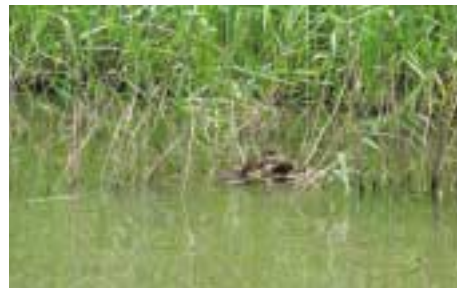
琵琶湖に生える葦

日本全国にある湖沼や河川に群生する葦は、水の汚れの原因となるリンや窒素の吸収率が高く、建材や葦簀(よしず)として利用されてきました。葦は1本で2トンの水を浄化する能力があると言われていましたが、近年では生活環境の変化などにより、有効活用が進んでいませんでした。