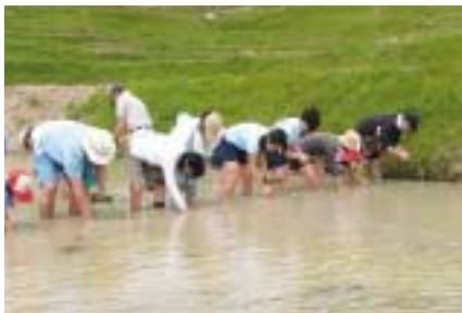
大山千枚田、田植え風景

当社では、棚田オーナー制度の導入や、社員による農作業支援などにより、大山千枚田の保存に協力しています。