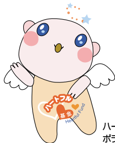
ハートフル基金のキャラクター ボランちゃん

ハートフル基金制度には、平成17年12月末現在で、2,265名が加入しています。